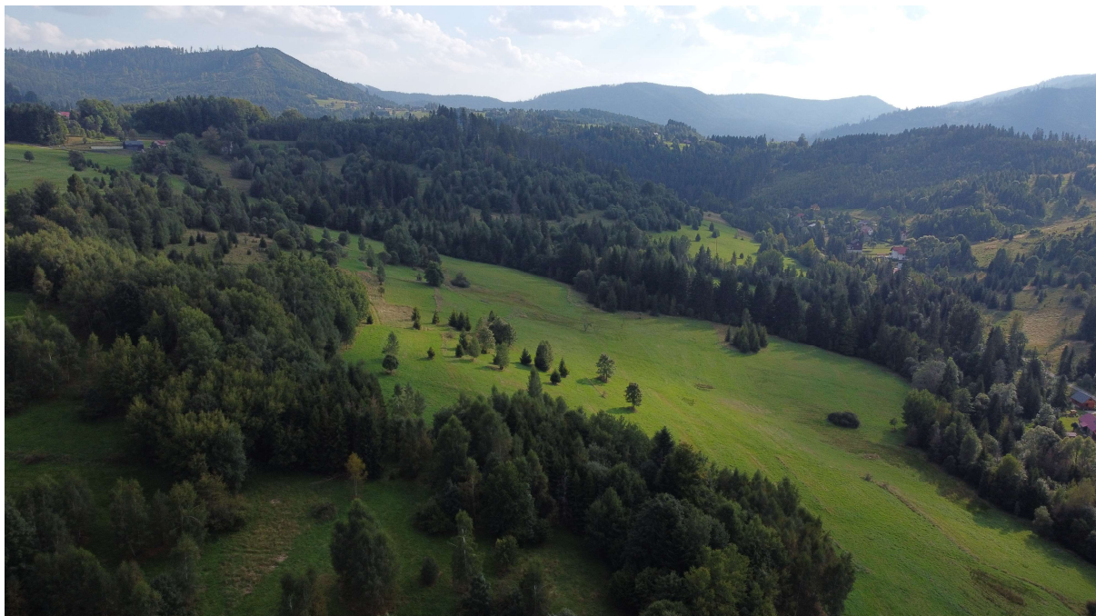
Wnętrze krajobrazowe z polaną pasterską w rejonie Glinki