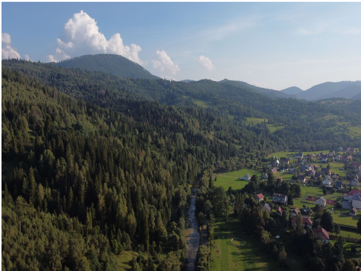
Otwarcie widokowe z doliny Glinki w kierunku grzbietu głównego Beskidu Żywieckiego