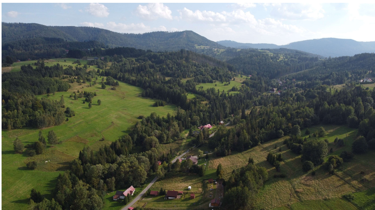
Mozaika krajobrazowa na stokach otaczających Glinkę