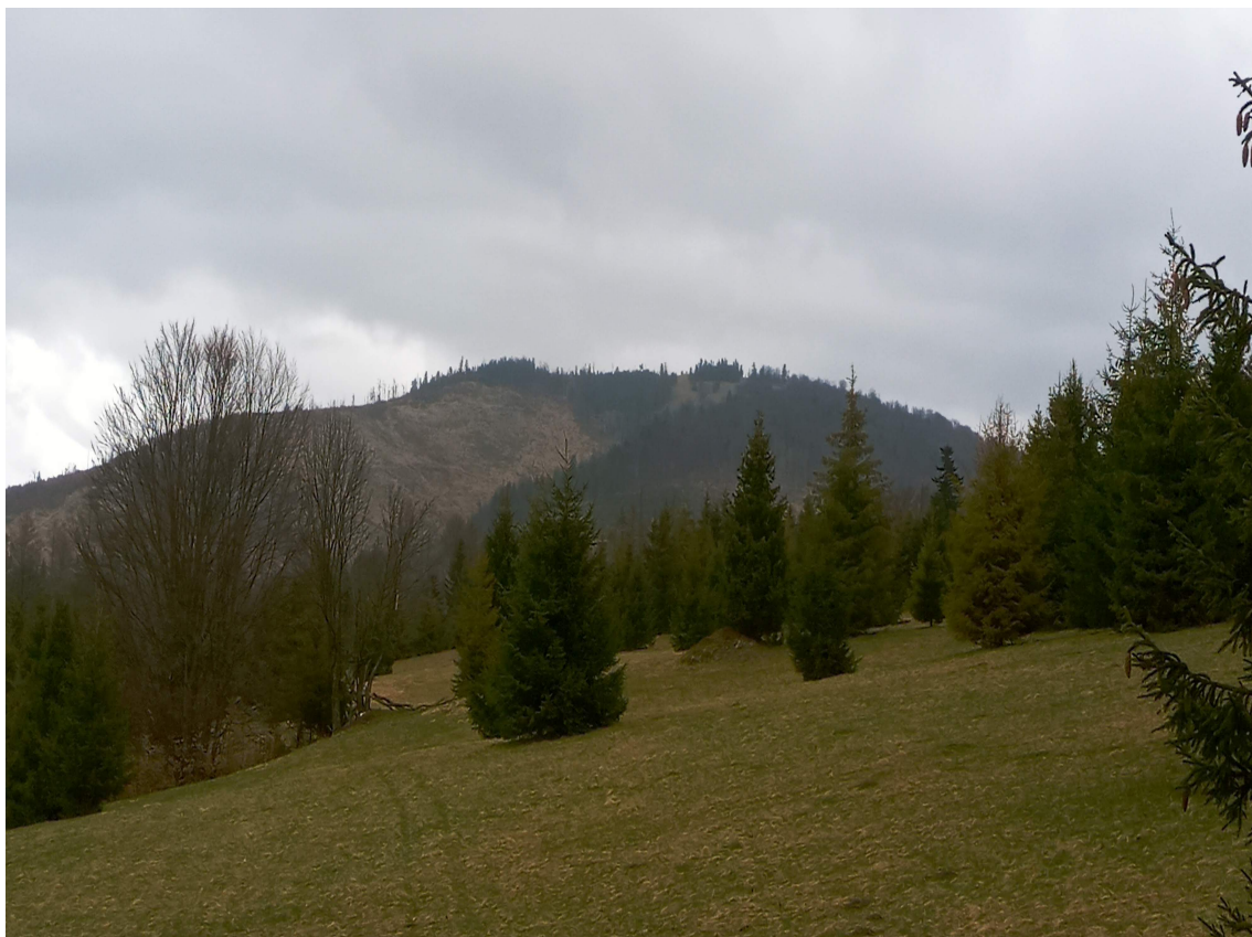
Krajobraz leśny w paśmie Wielkiej Raczy - wyraźna sukcesja lasu na dawnej polanie pasterskiej położonej na grzbiecie prowadzącym w kierunku Praszywki Dużej