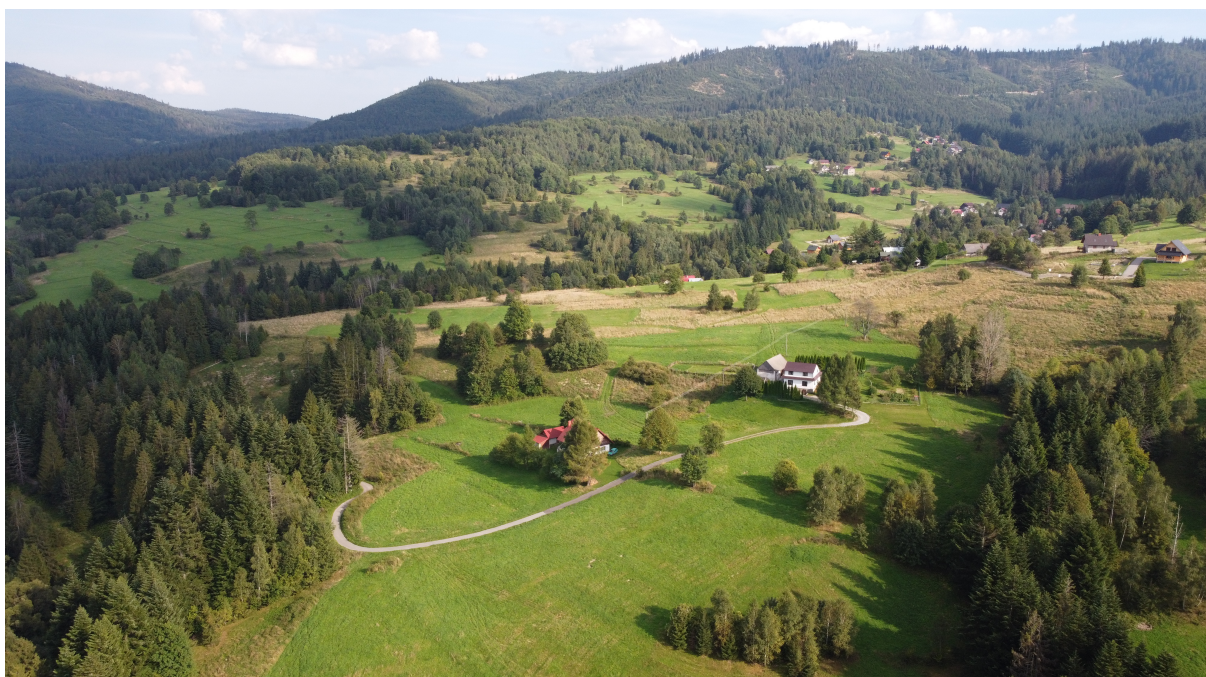
Zarastające tereny rolnicze i rozproszona zabudowa w rejonie Glinki